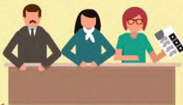
места выдачи бюллетеней

Избиратель, голосующий по месту нахождения, предъявляет документ, удостоверяющий личность. Данные избирателя вносятся во вкладной лист списка избирателей.